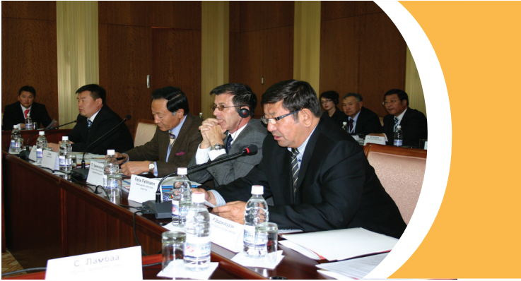
“Бичил уурхай ба хөдөөгийн хөгжил” үндэсний зөвлөлгөөн, Улаанбаатар хот, 2009.10.13