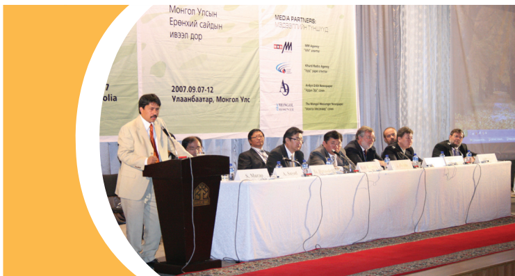
CASM VII хурал, Улаанбаатар хот, 2007.09.07-12 өдрүүд